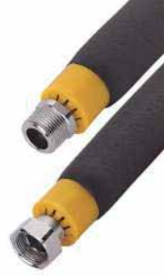
● İzoleli Fancoil Flexleri