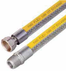
● Ocak Bağlantı Flexleri