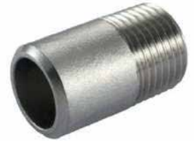
● Dişli Boru Parçası