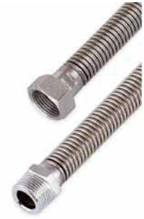
● Çıplak Fancoil Flexleri