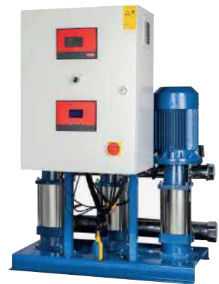
● Frekans Kontrollü Hidrofor