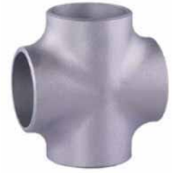
● Orj Patent Kruva