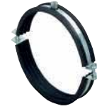
● Havalandırma Kelepçesi