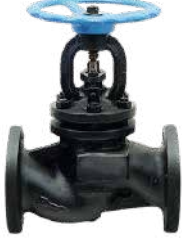
● Baskılı Glob Vana