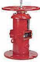
● Yatay İndikatörler