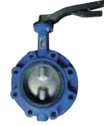
● Kelebek Vana Lug Tip