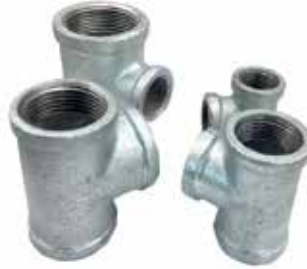
● Galvaniz Te