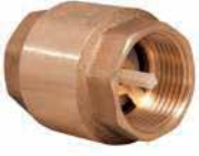
● Pirinç Yaylı Çek Vana