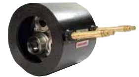
● Dinamik Balans Vanası