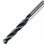
● Matkap Ucu