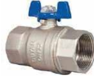
● Pirinç Kelebek Kollu Vana