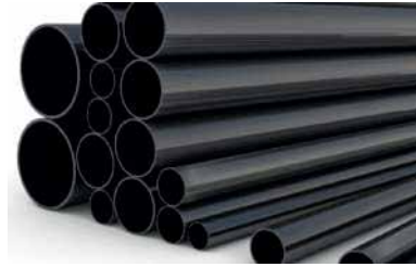
● Siyah Boru