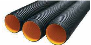
● Triplex Boru