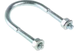
● U Bolt