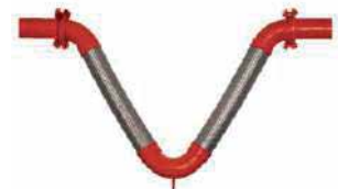
● V-Flex Bağlantı Elemanı