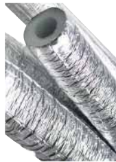
● Alüminyum Folyolu Boru İzole