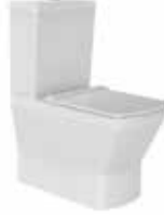
● Duvara Sıfır Klozet