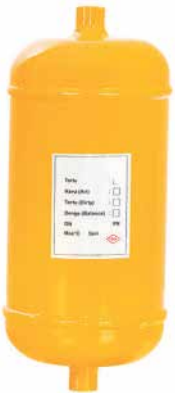
● Hava Tüpü