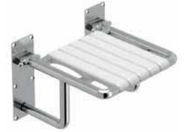
● Engelli Duş Oturağı