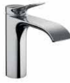
● Lavabo Bataryası