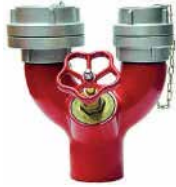
● İtfaiye Bağlantı Ağızı