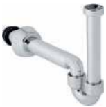
● Lavabo Sifonu