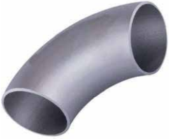
● Dikişli Patent Dirsek