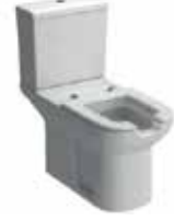
● Engelli Klozeti