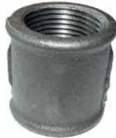
● Siyah Manşon Galvaniz