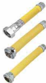
● Sayaç Bağlantı Flexi