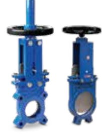
● Bıçaklı Sürgülü Vana