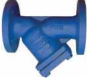
● Pislik Tutucular