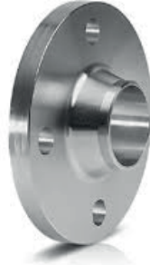
● Kaynak Boyunlu Flanş