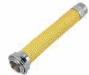
● Kaskad Gaz Bağlantı Flexi