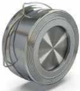
● Disco Çekvalf