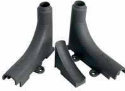
● Köşe Düzeltme