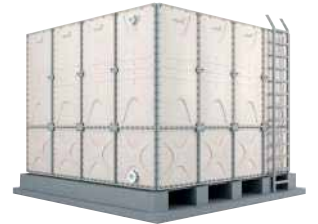
● GRP Su Deposu

Su depoları, su kaynaklarının yönetiminde kritik bir rol oynar. Özellikle suyun kesintiye uğradığı durumlarda veya talep artışında güvenilir bir su kaynağı sağlar. Su depolama sistemleri, suyun düzenli bir şekilde dağıtılmasını ve israfın önlenmesini sağlayıp, büyük ölçekli projelerde ve acil durum senaryolarında suyun sürekli erişilebilirliğini temin ederek, çevresel ve insani ihtiyaçların karşılanmasına katkıda bulunur.