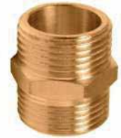
● Sarı Nipeller