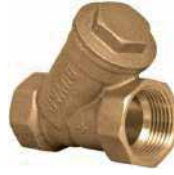
● Pirinç Y Tipi Pislik Tutucu