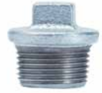
● Galvaniz Tapa Dış Vidalı