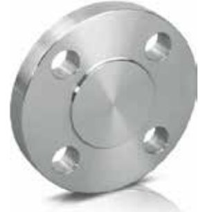
● Kör Flanş