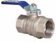
● Pirinç Küresel Vana