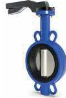
● Kelebek Vana Wafer Tip