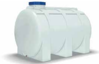
● Plastik Su Deposu