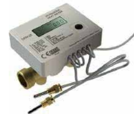
● M Bus Ultrasonik Kalorimetre

Tedarikliğini sağladığımız yerden ısıtma sistemi ürünleri yerden ısıtma sistemlerinin verimli ve uzun ömürlü çalışmasını destekler, böylece hem enerji tasarrufu sağlar hem de sistemin genel performansını artırır.