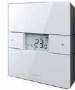
● Yerden Isıtma Termostat