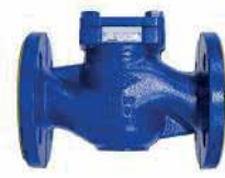
● Çekvalf Lift Tipi