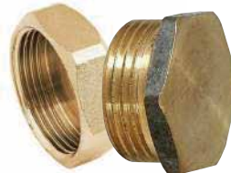
● Sarı Tapa