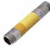
● Brülör Bağlantı Flexleri