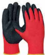
● İş Eldiveni