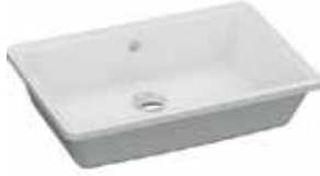
● Hilton Lavabo