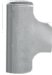
● Patent Te