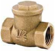
● Çalparalı Çekvalf