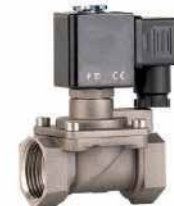
● Buhar Selenoid Valf

Vana sistemleri, su, gaz ve buhar kontrolünü sağlamak için kritik öneme sahiptir. Kataloğumuzda farklı uygulama ve ihtiyaçlara yönelik geniş bir vana grubu seçeneği sunuyoruz. Küresel su vanaları istenilen her çapta tedariki yapılmaktadır. Doğalgaz vanaları, bina içleri ve bina dışlarında standartlara uygun olarak üretilmektedir. Endüstriyel ve inşaat gruplarında gerekli olan buhar vanaları uluslararası standartlara uygun olarak tedariki yapılmaktadır.