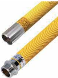
● Kompansatör Bağlantı