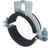
● Ağır Yük Kelepçesi