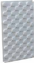
● Yerden Isıtma Straforu