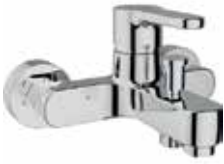
● Banyo Bataryası