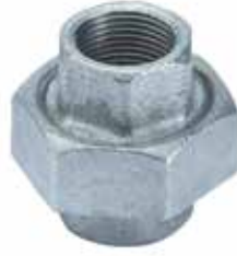
● Ons 1 Galvaniz Konik Rekor