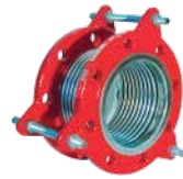
● Yangın Kompansatörler