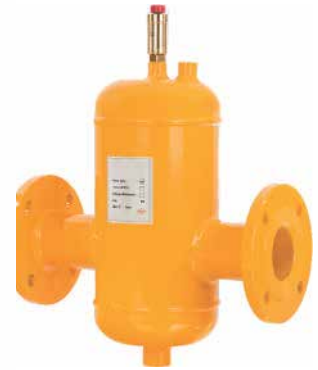
● Hava Ayırıcı