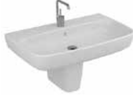
● Yarım Ayaklı Lavabo