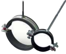
● Trifonlu Kelepçeler