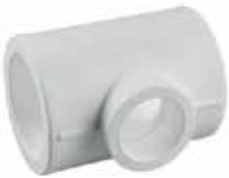
● İnegal Te