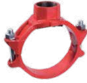
● Dişli Mekanik T