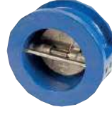
● Çekvalf Çift Plakalı