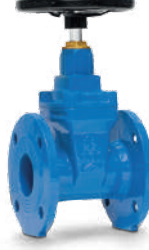
● Sürgülü Vana