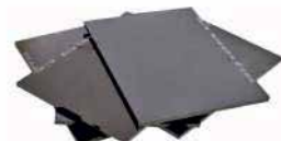
● Maske Camı