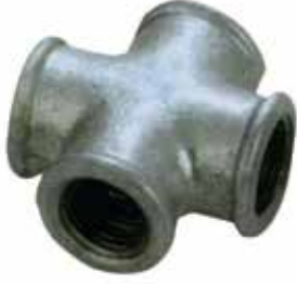
● Siyah İnegal Kuruva