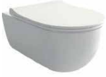
● Asma Klozet

Bünyemizde günlük yaşamınızı daha konforlu ve işlevsel hale getirecek çeşitli montaj ve kaplama ürünleri bulunmaktadır. Ürünlerimiz tesisat sistemlerinizin temiz ve sorunsuz çalışmasını sağlar, modern tasarımları ve ergonomik yapılarıyla hem şıklığı hem de konforu bir arada sunar. Aynı zamanda Kullanıcı dostu özellikleri ve yüksek kalite malzemeleri ile uzun ömürlü performans yaşam alanlarınızı daha fonksiyonel ve rahat hale getirmeyi amaçlar.