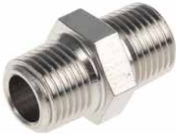
● Galvaniz Nipel