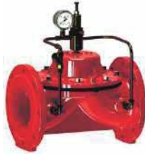
● Relief Vana