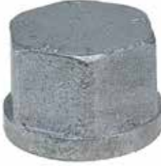
● Galvaniz Tapa İç Vidalı Kapak