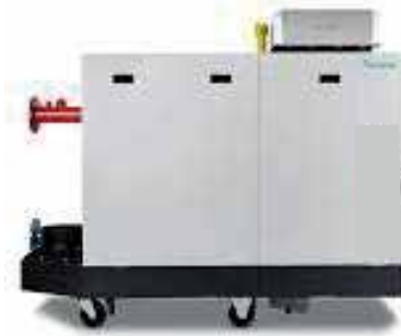
● Yer Tipi Kazan