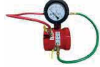
● Akış Ölçer