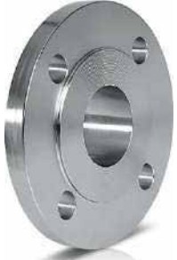
● Düz Flanş