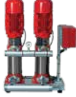
● Yangın Hidroforu