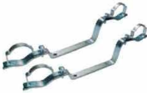
● Kollektör Kelepçesi