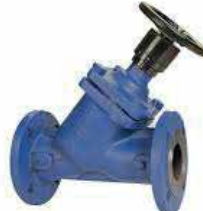
● Statik Balans Vanası