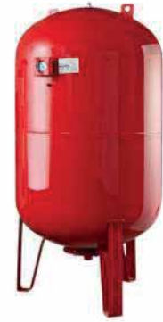
● Genleşme Tankı