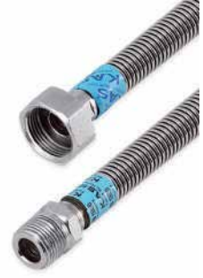
● Su Bağlantı Flexleri