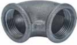
● Siyah Dirsek