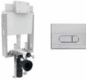
● Duvar İçi Gömme Rezervuar