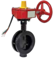
● İzlenebilir Kelebek Vana