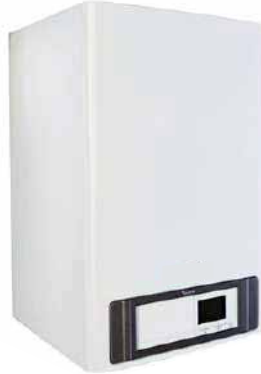
● Duvar Tipi Yoğuşmalı Kazan