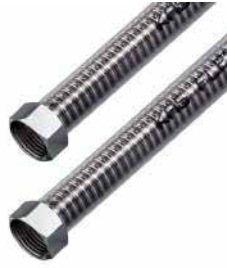
● Klozet Bağlantı Flexi