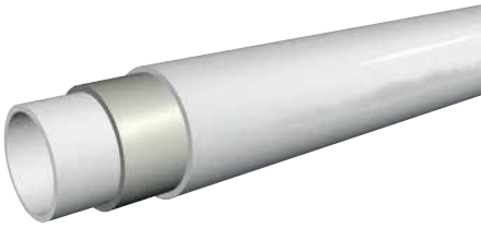
● Kompozit Boru