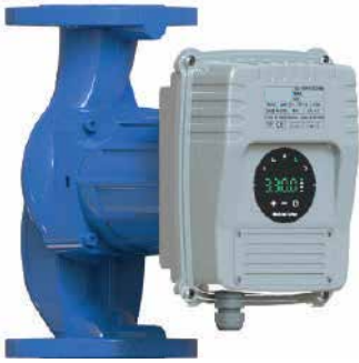
● Sirkülasyon Pompası