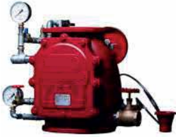
● Alarm Vana Sistemi