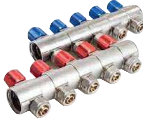
● Kendinden Vanalı Kollektör