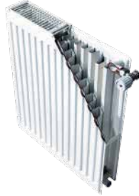
● Panel Radyatör (Petek)