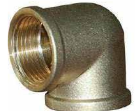
● Sarı Dirsek