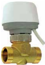
● Motorlu Vana