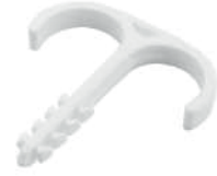
● Dübelli Yere Tespit (Kılçık)