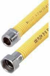
● Gaz Bağlantı Flexleri