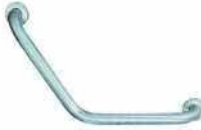
● Engelli Klozet Tutamağı