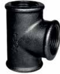
● Siyah Te