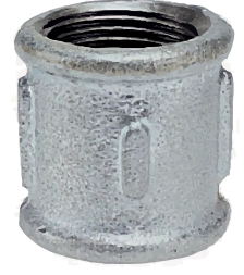
● Döküm Manşon Galvaniz