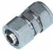
● Bağlantı Elemanı