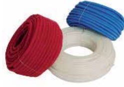
● Spiral Boru