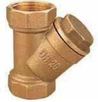
● Pislik Tutucu