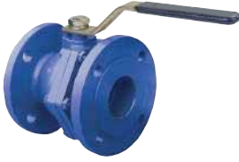
● Küresel Vana