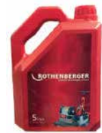
● Rothenberger Yağı