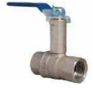
● Pirinç İzolasyon Boyunlu Vana