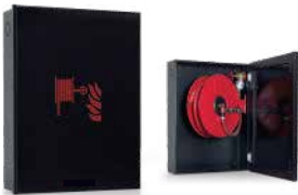
● Yangın Dolapları

İhtiyaçlarınıza uygun çözümleri sağlamak ve güvenliğinizi en üst düzeye çıkarmak için profesyonel ekibimizle her zaman yanınızdayız.