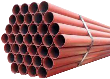
● Boyalı Boru