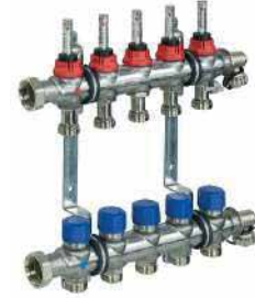
● Debi Göstergeli Kollektör