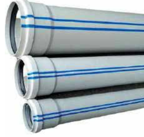
● PVC Boru