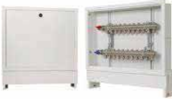
● Kollektör Dolabı

Yerden ısıtma sistemleri, iç mekanlarda konforlu bir ısı dağılımı sağlamak amacıyla kullanılan etkili bir ısıtma yöntemidir. Bu sistemler, zemin altına yerleştirilen boru veya kablo şebekeleri aracılığıyla sıcaklık sağlar. İki ana türü bulunur: su bazlı sistemler ve elektrikli sistemler. Su bazlı sistemlerde, zemin altındaki borulardan sıcak su dolaştırılırken, elektrikli sistemlerde ise elektrikli ısıtma kabloları kullanılır. Bu sistem, ısının zemin boyunca eşit şekilde dağıtılmasını sağlayarak daha homojen bir sıcaklık sağlar ve bu da enerji tasarrufu ile birlikte daha düşük enerji maliyetleri anlamına gelir.