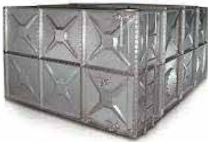
● Galvaniz Modüler Su Deposu