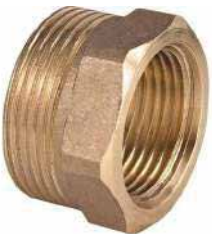
● Sarı Redüksiyon