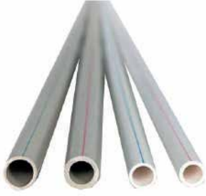
● PPR-C Boru