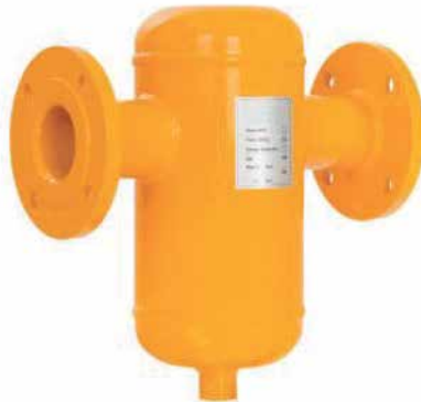
● Tortu ve Pislik Ayırıcı