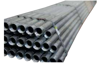
● Galvaniz Boru