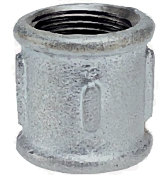
● Döküm Manşon Galvaniz

Yüksek kaliteli, temper dökme demirden üretilen, siyah ve galvaniz boru ekleme parçaları, TS EN 10242 Design Symbol "A" standardına uygun olarak tasarlanmaktadır. Bu ürünler, dayanıklılığı ve uzun ömürlü kullanımı garanti eden sıkı kalite kontrol süreçlerinden geçirilerek üretilir. Mükemmel sızdırmazlık özellikleri ile dikkat çeken bu dirsek fittingsler, boru sistemlerinde yönlendirme ve bağlantı ihtiyaçlarınız için idealdir. Hem sanayi Hem de ev kullanımına uygun ürünler, paslanmaya ve korozyona karşı üstün direnç sunar. Montajı kolay ve pratik olan siyah dirsek parçalarımız, boru sistemlerinizin verimliliğini ve güvenliğini artırır.