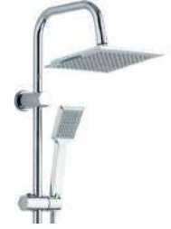
● Duş Seti