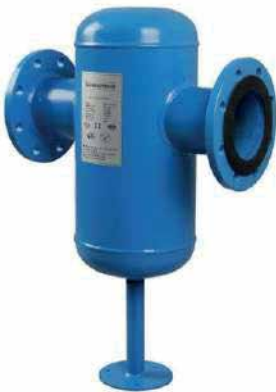
● Tortu Tutucu