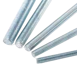
● Rot (Tij)