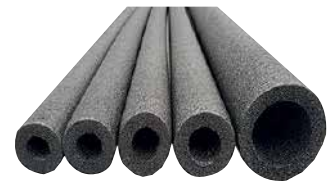
● İzole Boru Kılıfı

PVC-PPRC-DEMİR boru tesisat ve ek parçaları, modern inşaat projelerinde hayati öneme sahiptir. Bu ürünler, su tesisatı sistemlerinin temel bileşenlerini oluşturur ve uzun ömürlülük, esneklik, ve ekonomik verimlilik sağlar. Bu ürünler yüksek ısı direnci ve kimyasal dayanıklılık özellikleri ile dikkat çeker. Bu borular, su ve ısı sistemlerinde sıklıkla tercih edilir. Paslanmaz ve korozyona uğramaz özelliktedirler.