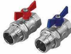
● Termokupullu Küresel Vana