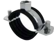
● Somunlu Kelepçeler